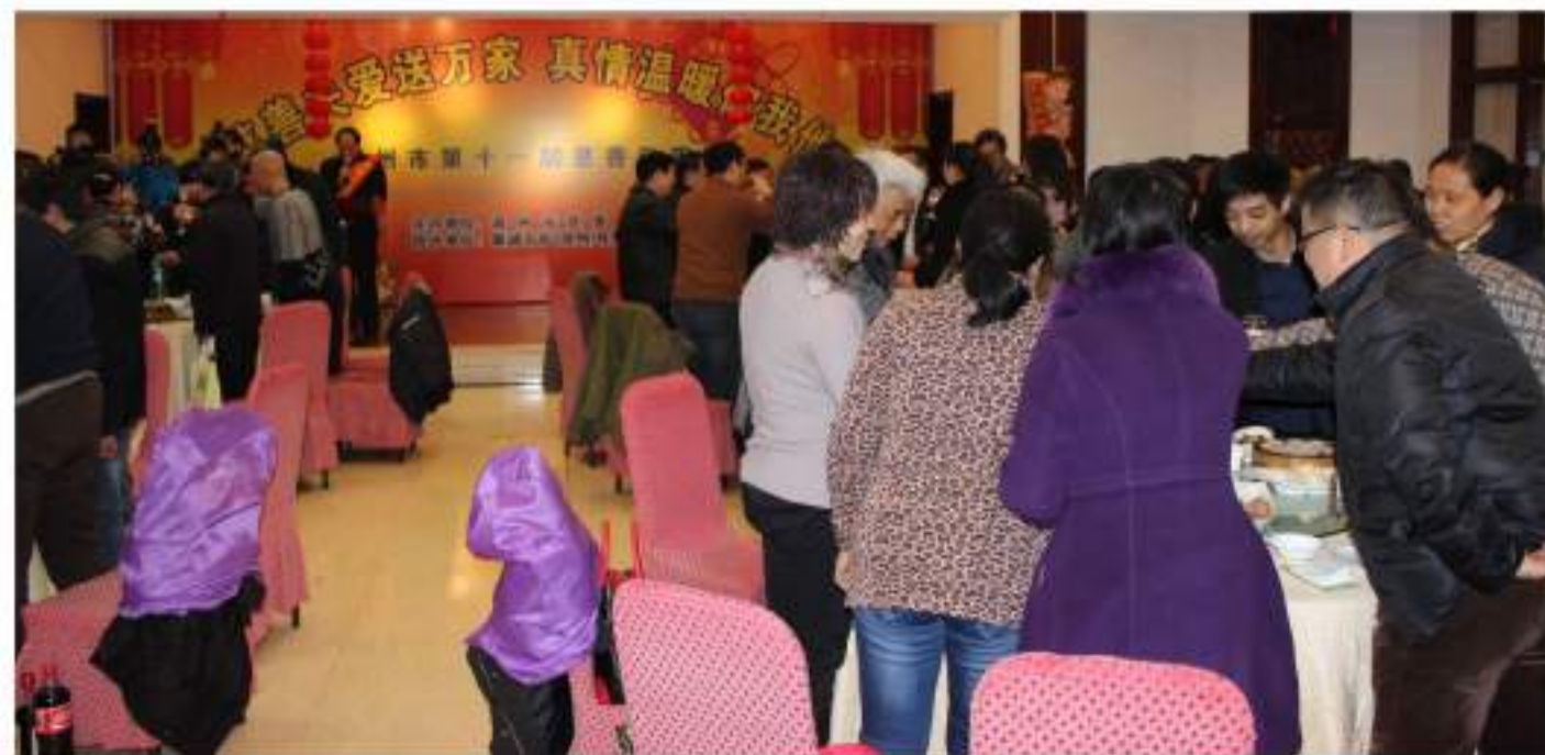
由康诚慈善基金出资协办湖州市第十一届慈善年夜饭