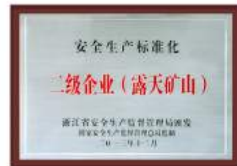
安全标准化二级企业