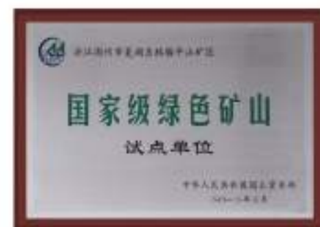
国家级绿色矿山试点单位