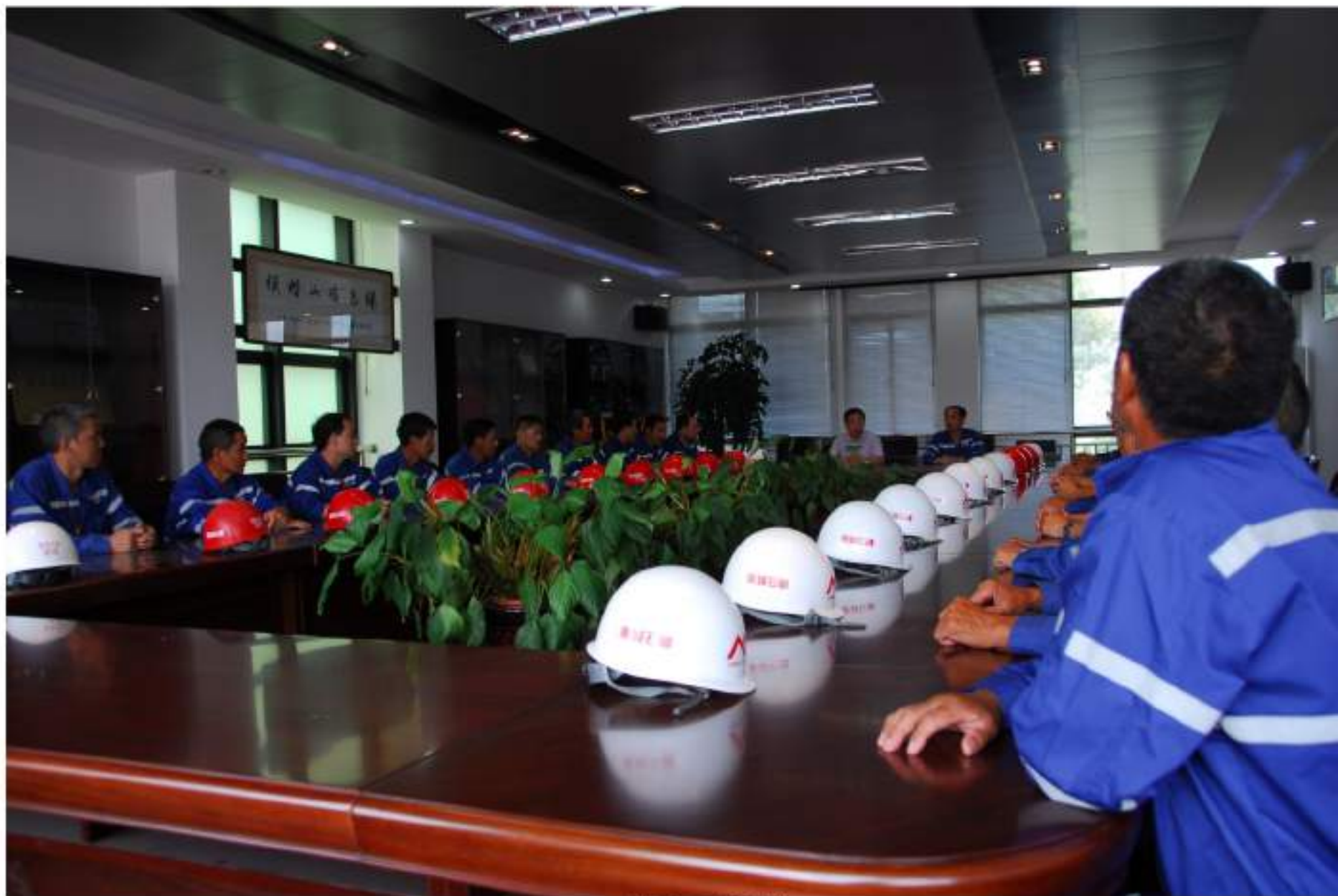
管理人员安全例会