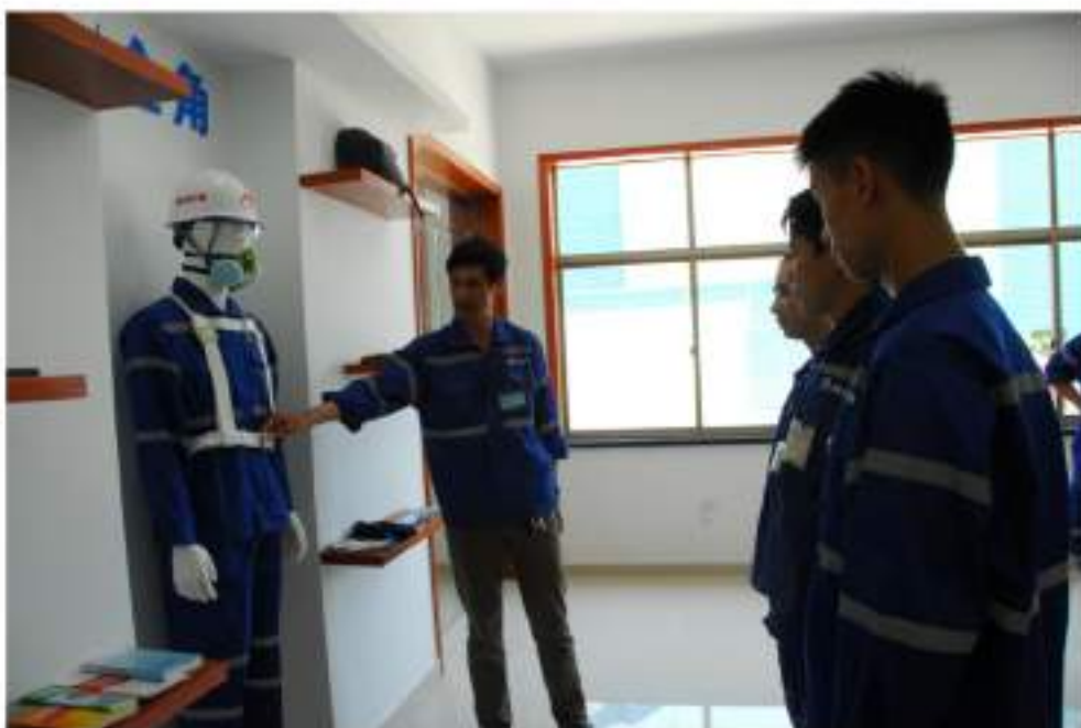
新员工入职安全教育