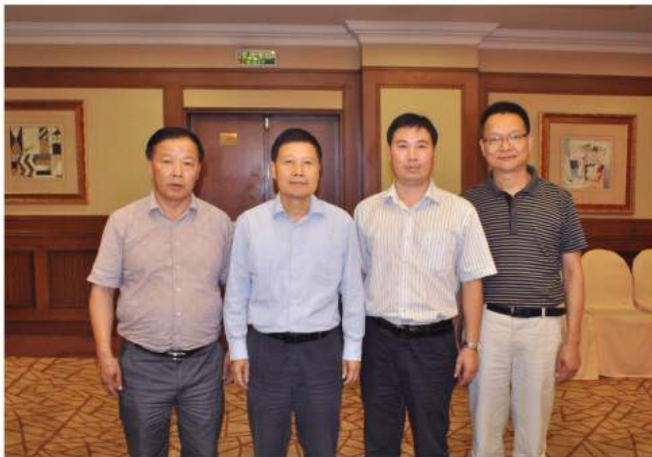
浙江省国土资源厅时任党组书记、厅长 楼小东（左二）