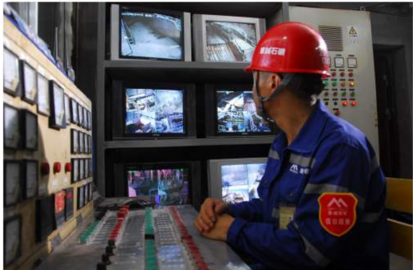
自动化三级连续破碎生产控制系统