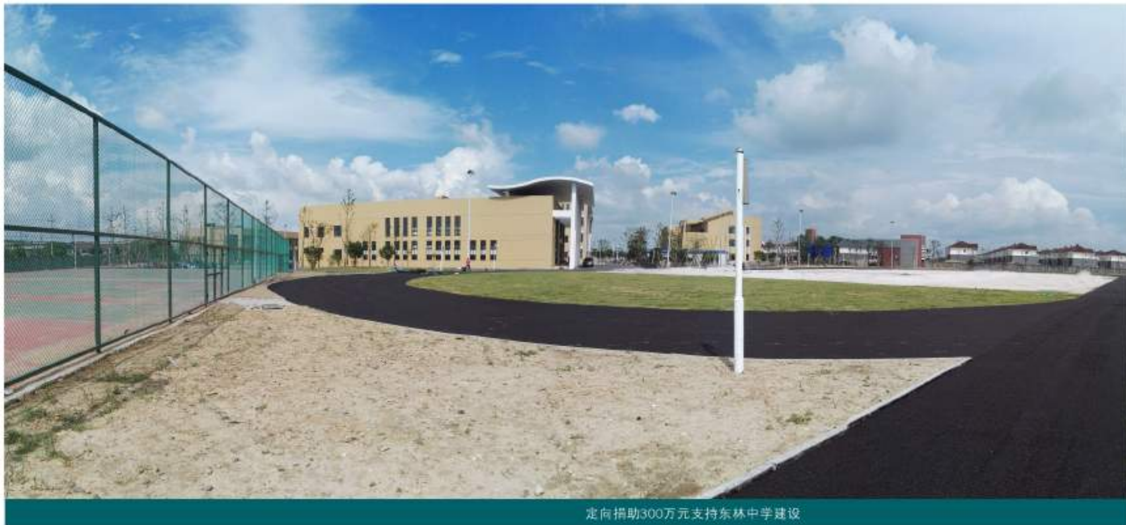
定向捐助300万元支持东林中学建设

热心公益、服务社会，为构建和谐和谐社会奉献应有之力，既是企业应该承担的社会责任，也是企业自身持续稳定发展的重要条件。2009年以来，公司每年出资50万元，设立市、区两级“康诚慈善救助基金”，帮扶救助社会弱势群体和困难群众，至今已累计出资350万元；2014年定向捐助300万元，支持东林中学建设，促进地方教育事业的发展；捐助90万元并无偿提供价值100余万元的石料，支持当地公路建设，改善百姓的出行条件；出资70万元帮助当地村建设公墓；公司在“四边三化”、“五水共治”等工作中先后捐款80万元；公司还长年为当地基本建设及农民建房提供优惠的砂石料。公司在构建和谐和谐社会中充分发挥了积极的作用。