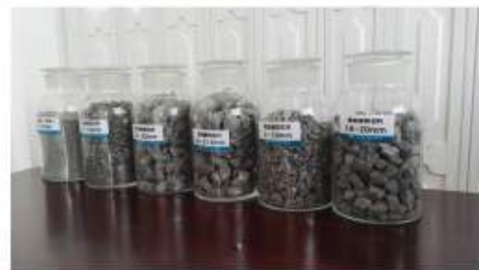
各类规格优质建筑石料