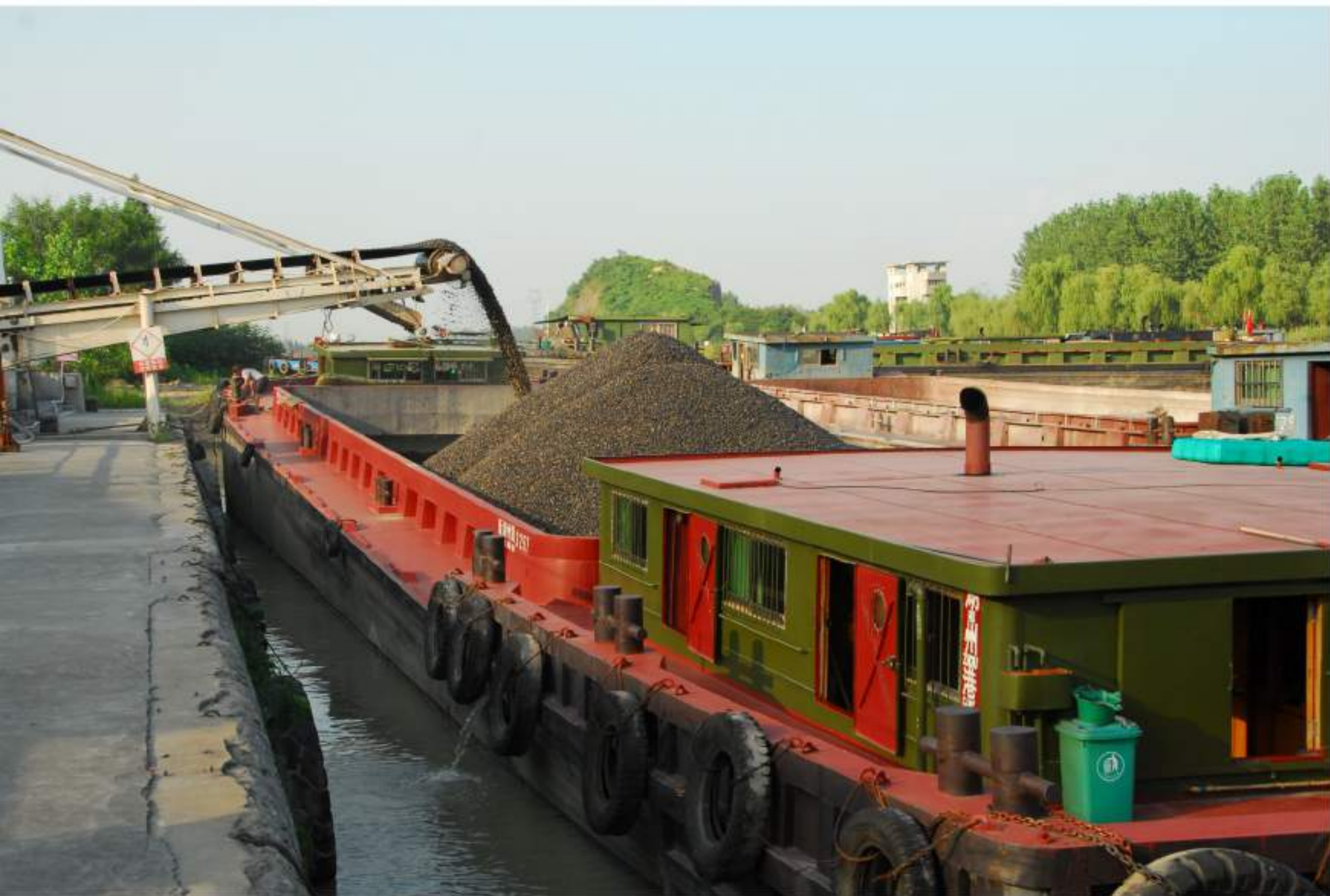
公司码头位于长湖申黄金水道，可四季通航千吨级船舶，水路运输极为便利。