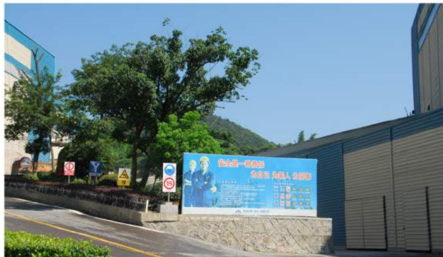
矿区内各类安全生产警示牌