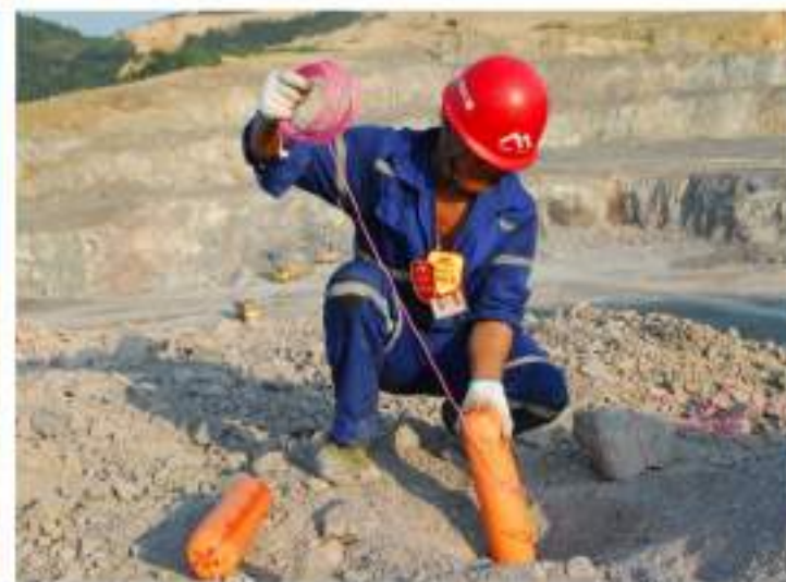
奥瑞凯中深孔高精度毫秒微差逐孔爆破