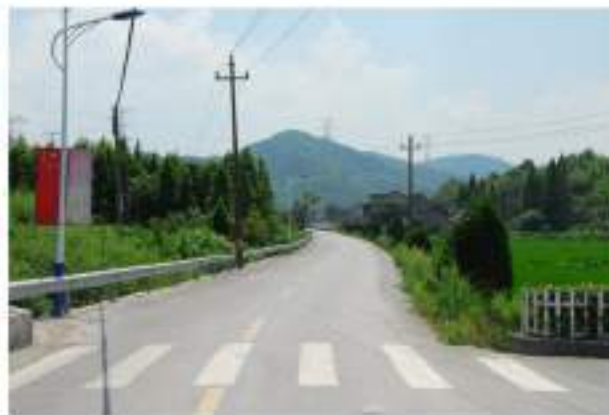
出资建设当地村级公路,并无偿提供石料