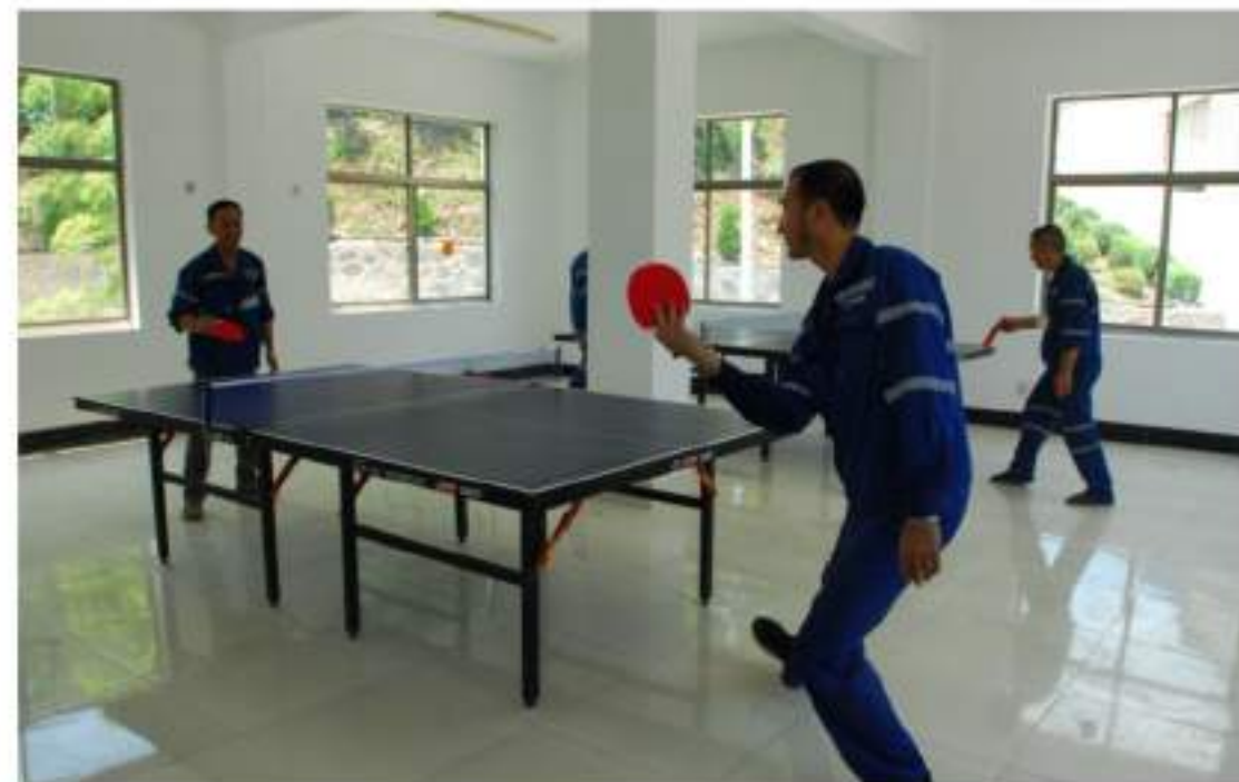
员工午休时间乒乓球娱乐活动