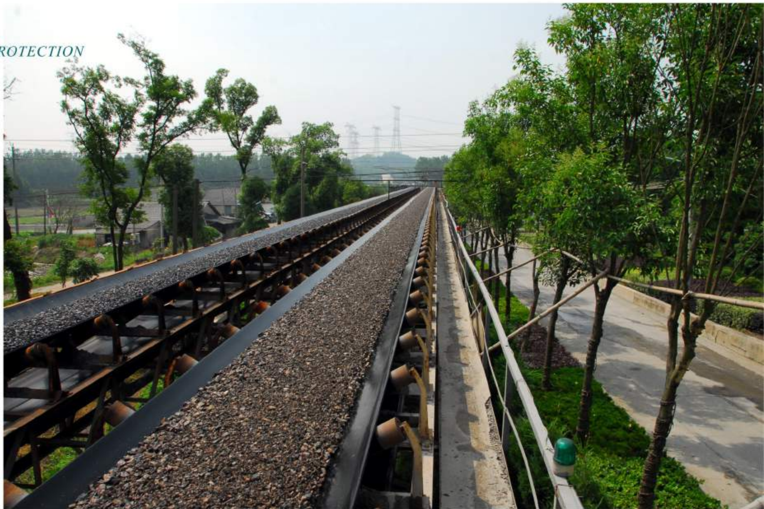
清洁环保的成品石料皮带输送长廊

环境保护工作与矿山的生态建设是密不可分的，只有全面做好矿山的各项环境保护工作，才能稳步提升矿山生态建设水平。一直以来矿山的粉尘、废水、噪声是困扰矿山的三大难题，也对矿山企业的整体形象造成了很大的负面影响。为了彻底改变这一现状，公司投资 2600 余万元对两条生产线进行工厂式全封闭，并安装水雾降尘系统，有效地防止生产过程中的粉尘、噪声。投资 1000 余万元建设 800 吨/小时生产废水循环处理及资源综合利用项目，该项目既保障了生产用水的循环使用，实现生产废水零排放，也节约了宝贵的水资源，同时公司积极与水泥、制砖等企业联手，为尾矿找出路，提升资源综合利用率。公司还投资 1300 余万元建设 1 公里长的两条成品石料皮带输送长廊，取得了节能降耗、杜绝运输扬尘、确保道路交通安全的三重收益。