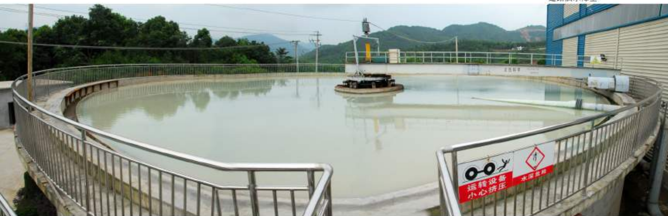
生产废水处理中心浓缩池