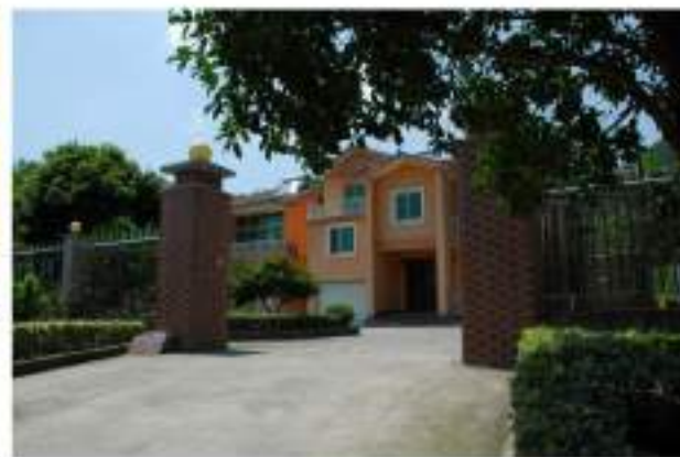
大力支持矿区周边新农村建设