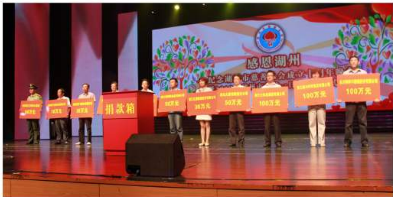
向湖州市慈善总会捐款30万元