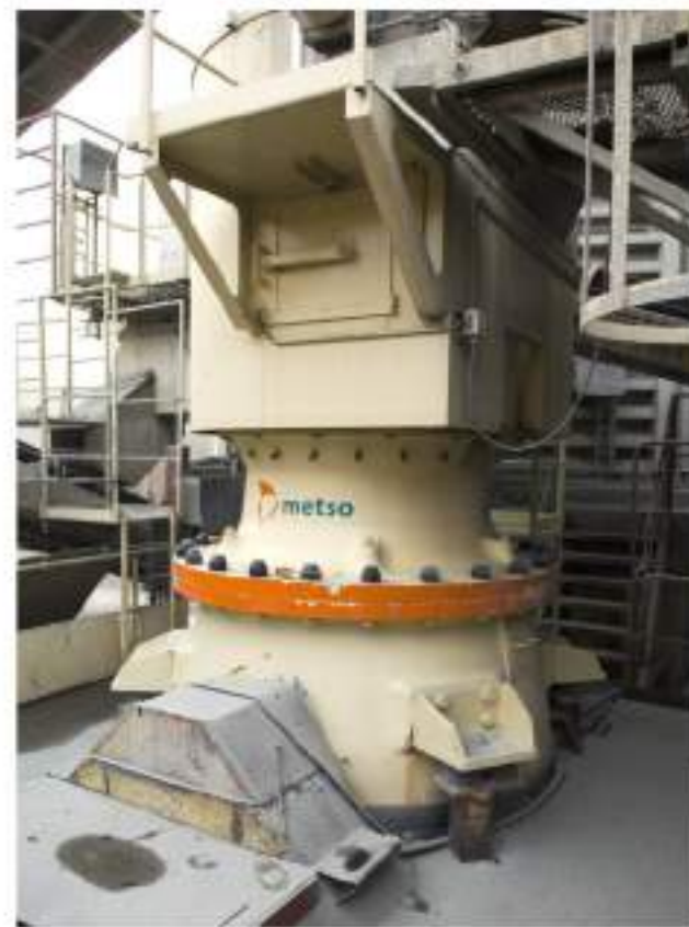
引进美卓等国际一流品牌的节能型鄂式、圆锥破碎等先进生产装备