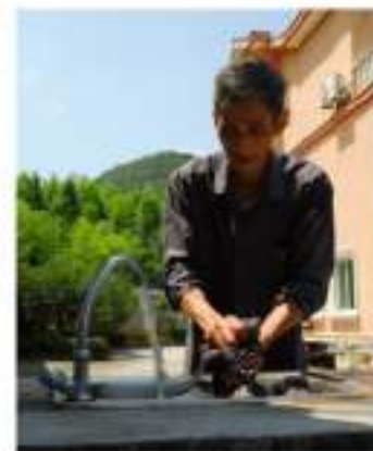
出资为农户引入自来水