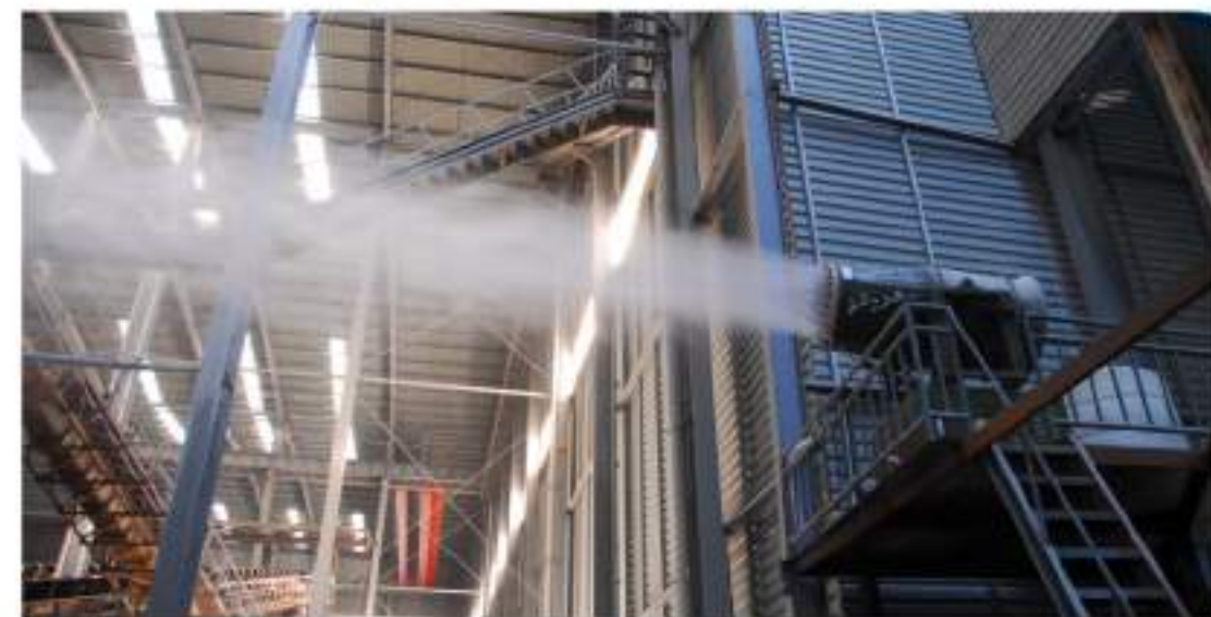
生产车间雾炮降尘