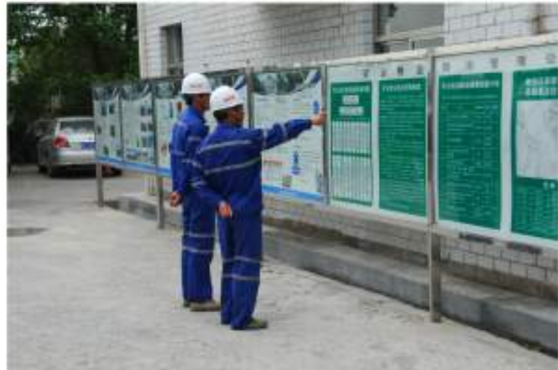
内容丰富的宣传栏