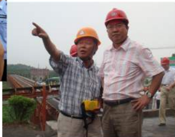
湖州市常务副市长 杨建新