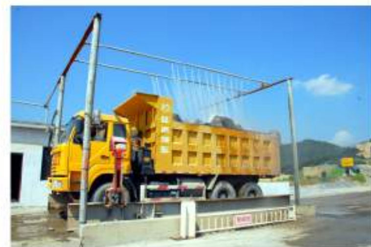
生产石料喷淋降尘