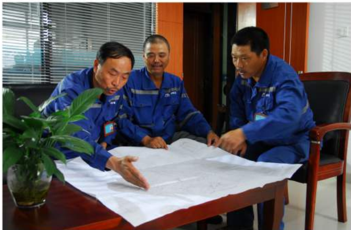
精心设计矿山开采方案