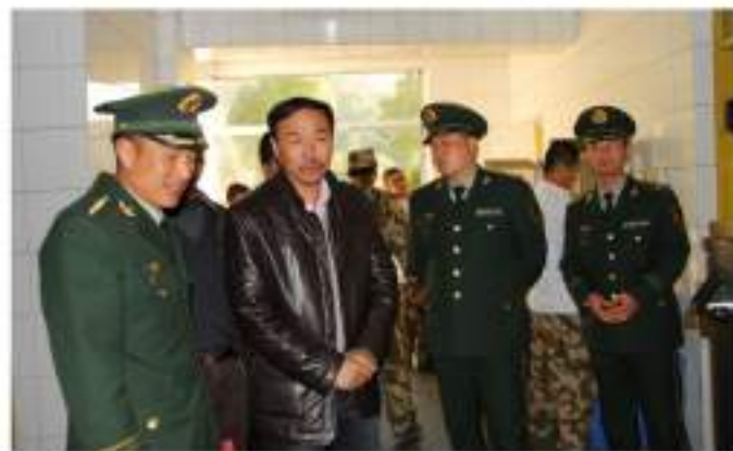
参观军民共建部队营房