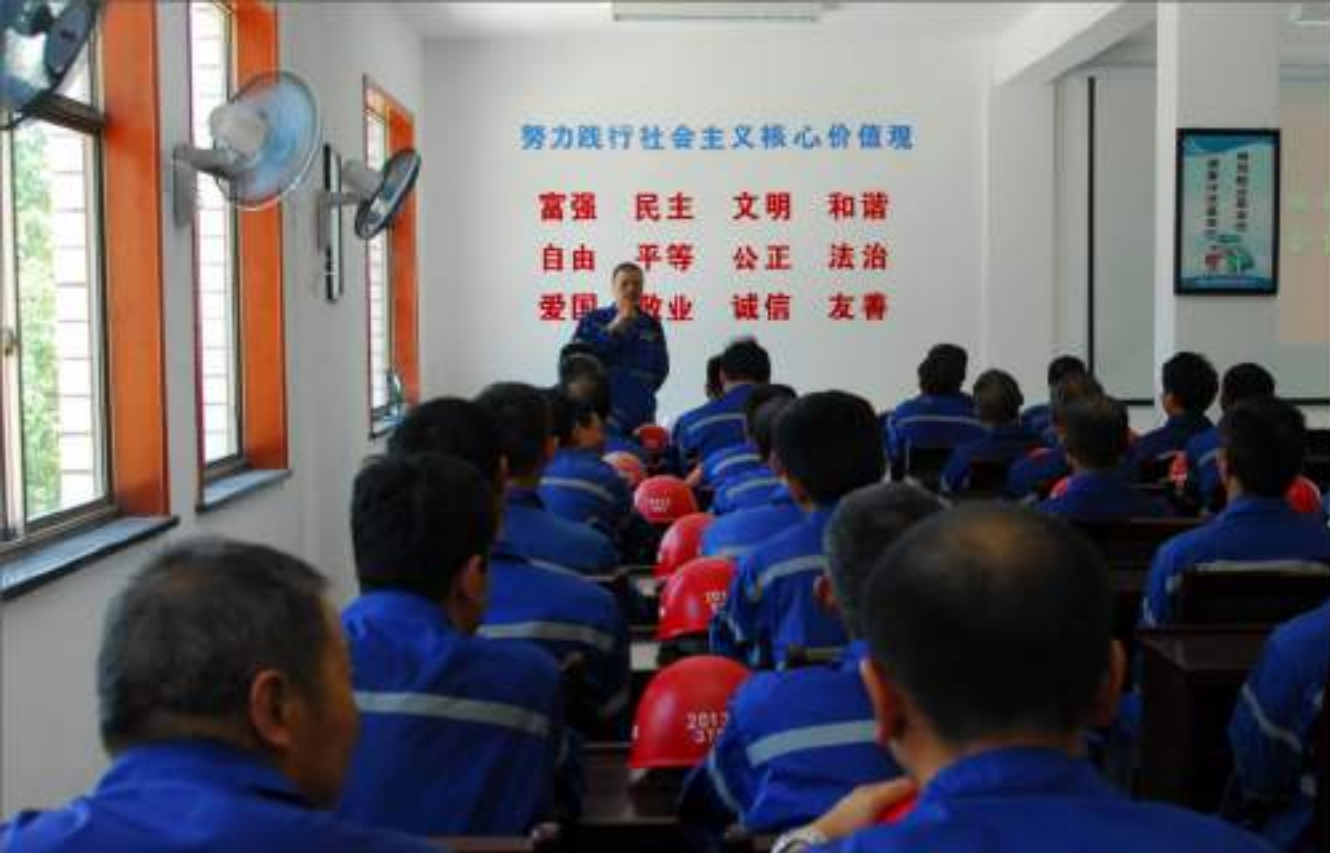
社会主义核心价值观教育