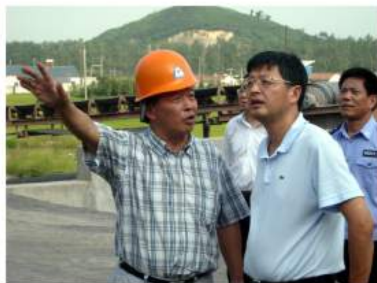
湖州市政协主席 吴水霖