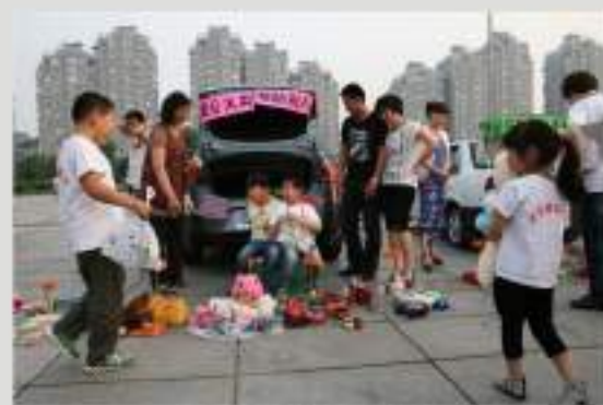
爱在后备箱-马升六