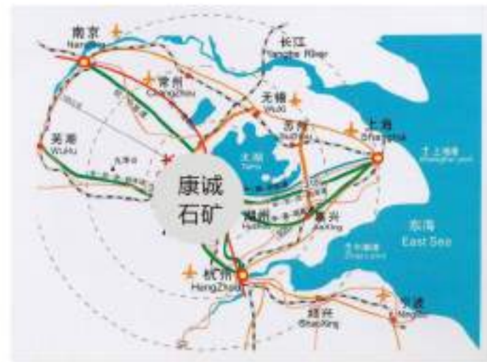
公司产品销售辐射长三角地区