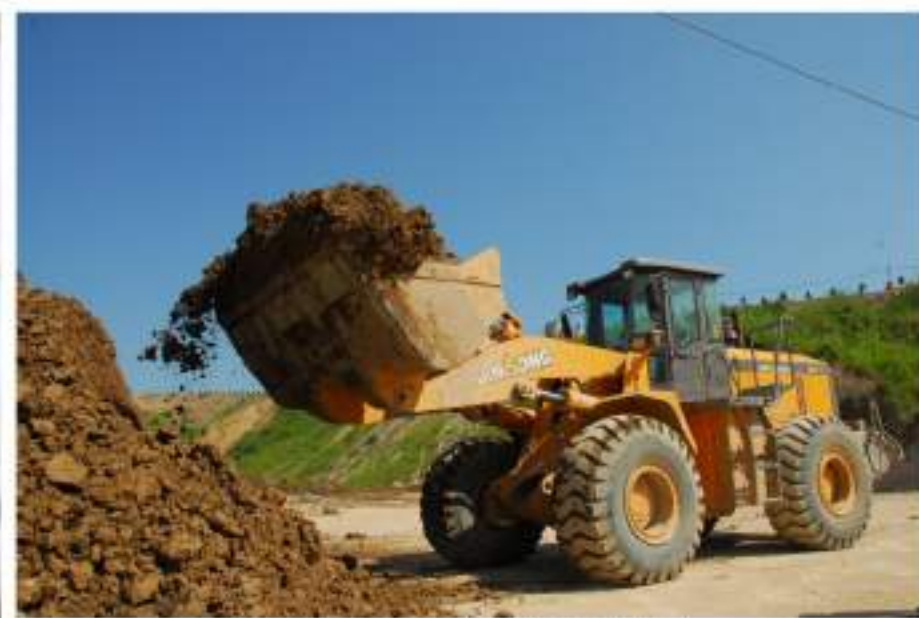
尾矿集中回收利用