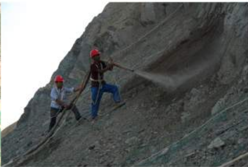
最终边坡喷播复绿