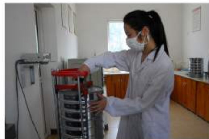
各类理化试验确保产品质量